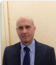
Rocco Garufo - Assessore Comune di Livorno