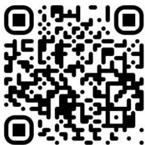
QR al sito del Tuscany Medieval Festival

PREVENDITE: https://www.liveticket.it/tuscanymedievalfestival